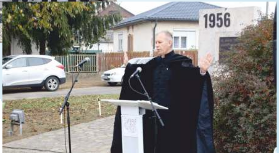
Október 23. - Nemzeti ünnep.