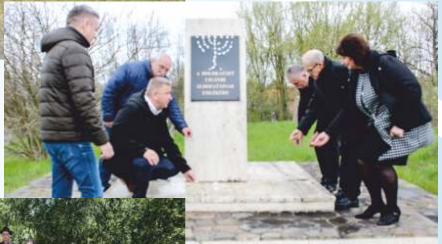
Április 16. - A holokauszt magyarországi áldozatainak emléknapja