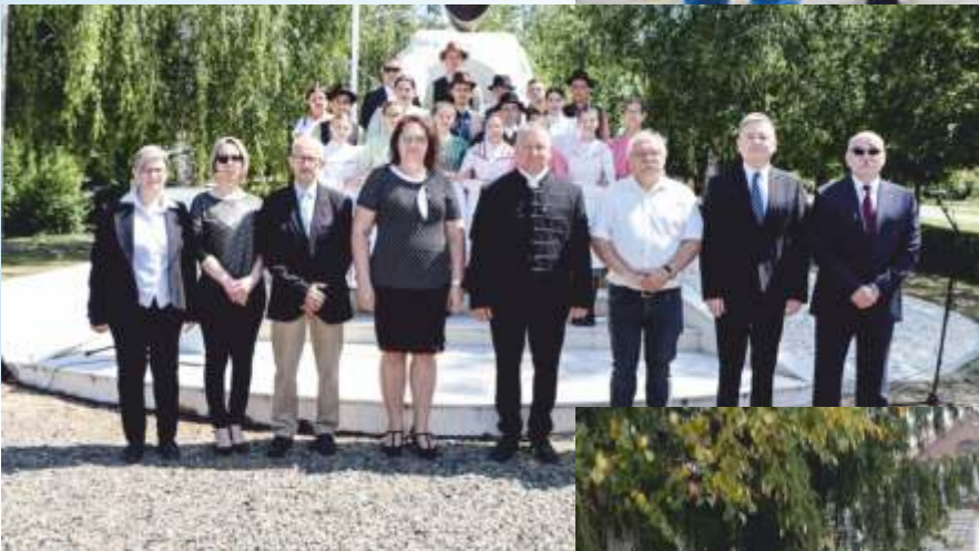
Június 4. - Nemzeti összetartozás napja.