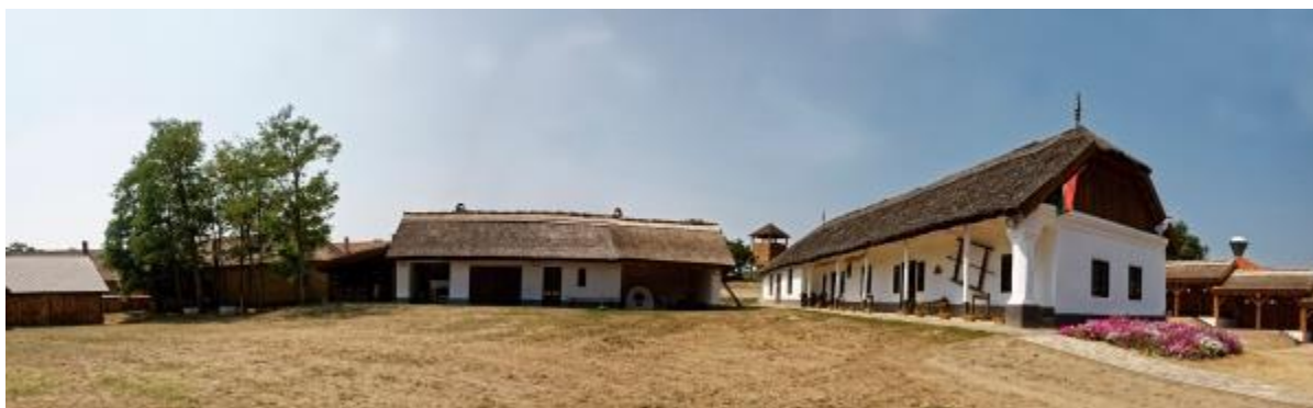
2. ábra: Falumúzeum és gazdasági épület

„A címer fő eleme, a pajzs a régi Nagycigánd és Kiscigánd községeknek a pecsétábrán megőrzött jelképeit tartalmazza, amelynek a pajzson való elhelyezkedése a két község egyesítésére utal. A pajzs talpát vágó hullámvonal a Tisza folyót jelképezi. Az oromdíszként szereplő szarvas egyaránt utal a táj természeti adottságaira, illetve a községek életében nagy szerepet játszó birtokos Sennyey és Vay családokra.” (Cigánd Város Hivatalos Honlapja)