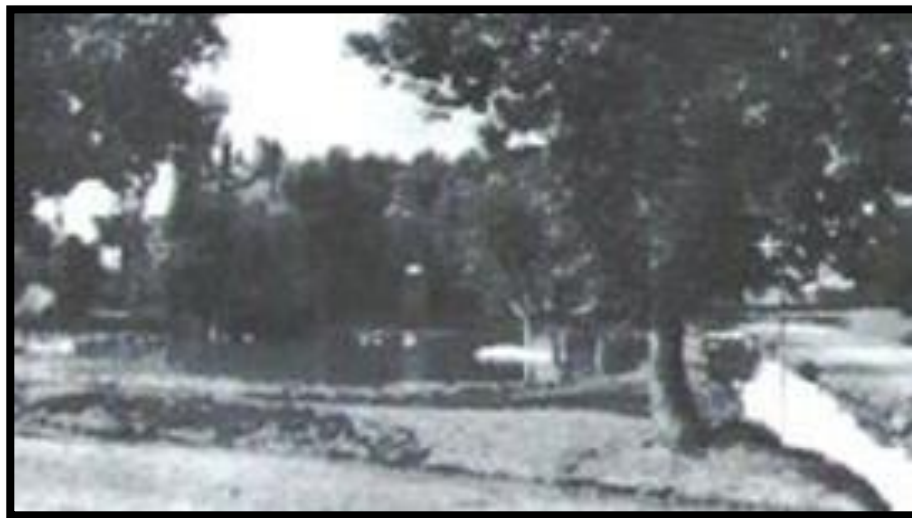
1. ábra: Mocsaras vidék, fotó: Ismeretlen alkotó

Cigánd a Bodrogtörzs keleti részén, a Tisza jobb partja közelében, helyezkedik el. A tiszai vagy középső táncdialektushoz tartozik. A tiszai áradások következtében ezek a települések mocsaras és lápos vidékké váltak. Az utak télen és a meleg, száraz nyáron voltak csak járhatók, ősszel és tavasszal pedig járhatatlanná vált a nagy áradások miatt. A településen élő emberek megélhetését a halászat, vadászat és a gyékényszövés tette lehetővé ugyanis az áradások miatt nem tudtak termőföldet művelni. Szabolcs megyét Cigántól a Tisza folyó választja el, ezért könnyen átmehettek, dolgozni és aratni az emberek.