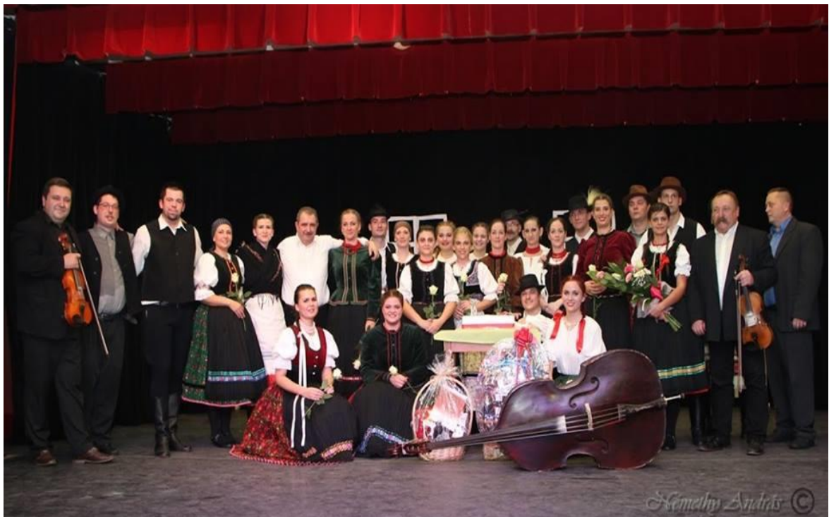
(12. ábra: Tíz éves jubileumi műsor, fotó: Némethy András, 2018)

egyik oka az is lehet, hogy nehéz sorsú térségben élünk, sem a felnőttek, sem pedig a gyerekek nem nyitottak eléggé a művészet felé. Nem motiváltak a közművelődés iránt, nagyon kevés azok száma, akik például színházba látogatnak.