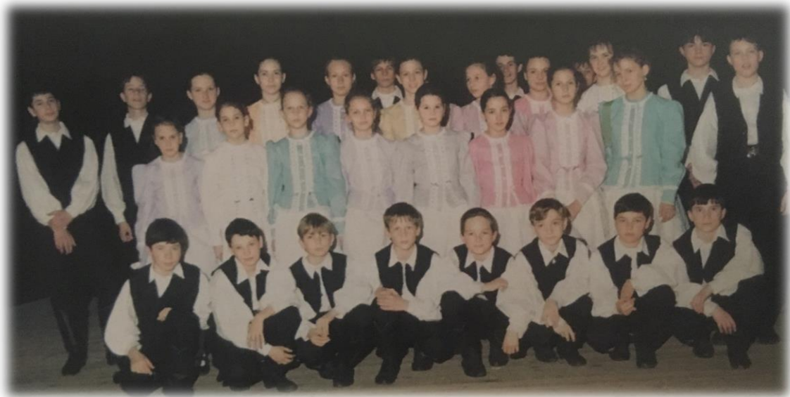
7. ábra: Zemplén Gyermekcsoport

A cigándi gyerekeknél nagyon mélyről erednek a táncművészet szeretetének gyökerei. Már a dédszüleik mindennapi életében szervesen beépültek a zempléni tájékon közkedvelt játékok, táncalkalmak, különféle szokások. Bár az életforma azóta itt is változott, mégis egy-egy visszaemlékezésben, aprócska gesztusokban máig is fellelhetőek a régmúlt szokások.