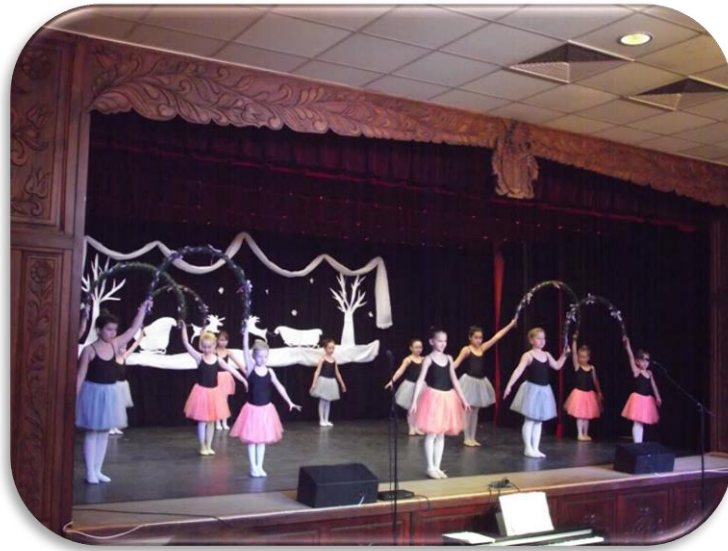
(14. ábra: Klasszikus balett csoport,)