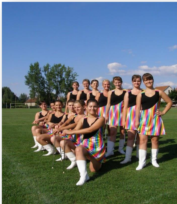
(13. ábra: Triangel Mazsorett, fotó: Némethy András, 2008)

Jelenleg három csoporttal működik a Triangel Mazsorett Táncsoport, örömeikre a mai napig jönnek a felkérések, amiket szívesen vállalnak. Minden fellépésről, versenyről szép emlékeket őriznek az egykori, illetve a mai tagok.