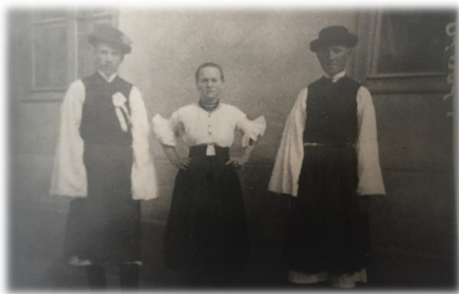
8. ábra: Cigándi viselet

Az 1910-es, 20-as években a legények váltani kezdték a viseletüket. Megjelent a szűk ujjú ing, ami fölé nyakkendőt, vékony mellényt és zakót vettek. Zsinórozás nélküli csizmanadrágot húztak a hátul varrott csizmához. Lakodalmakban még előkerült a szőttes kötény (surc) is. (Nagy, Cigándi Öröksége, 2004)